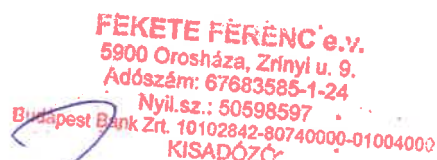
Fekete Ferenc egyéni vállalkozó